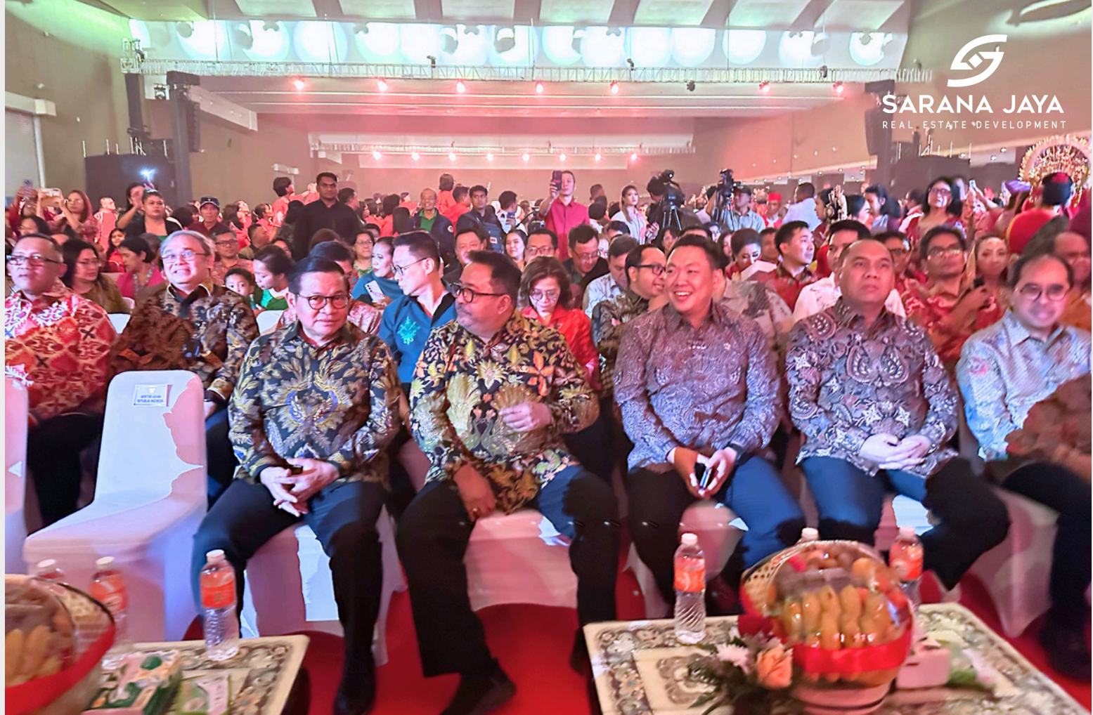
Direktur Utama Sarana Jaya turut hadir dalam perayaan Aktualisasi Nilai Natal 2025 bersama Pemprov DKI Jakarta