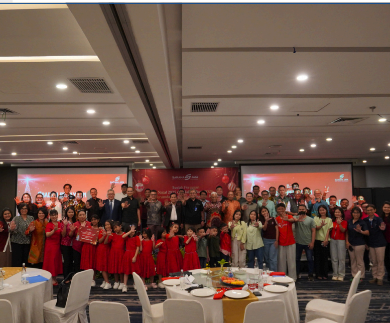
FOTO BERSAMA ANAK-ANAK PANTI ASUHAN DORKAS DAN PANTI ASUHAN HATI BANGSA,